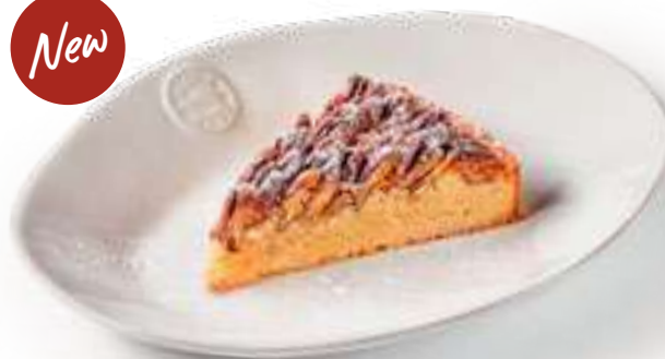
Тарт с пеканом Pecan tart

Из песочного теста сабле с миндальным франжипаном