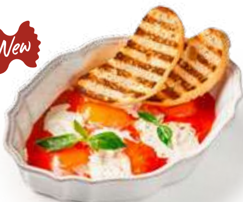
Яичница по-неаполитански Scrambled eggs Neapolitan style