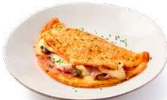
Омлет с ветчиной, грибами и моцареллой Omelette with ham, mushrooms and mozzarella