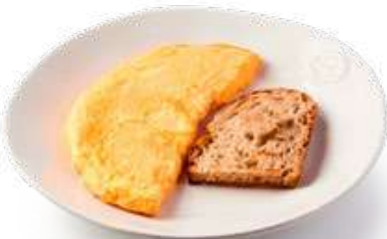
Омлет классический с пармезаном Classic omelette with parmesan