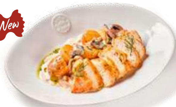
Куриная грудка с грибами и картофелем Chicken breast with mushrooms and potatoes