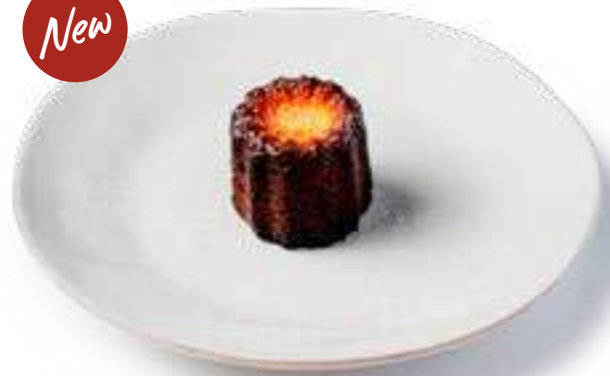
Канелле ванильное Cannelle vanilla

Французская выпечка с хрустящей корочкой и нежным тестом с ванилью внутри