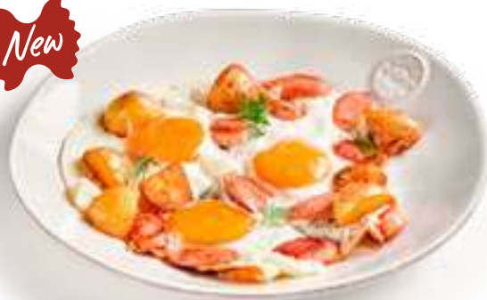
Яичница с сосисками и картофелем Scrambled eggs with sausages and potatoes