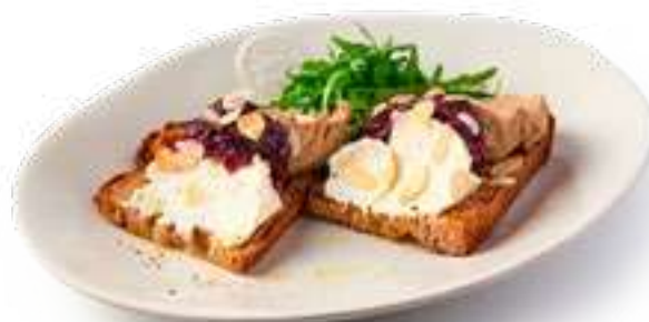
Брускетта с куриным паштетом и луковым джемом Bruschetta with chicken pate and onion jam

На сером хлебе с творожным сыром, карамелизированным луком с мёдом