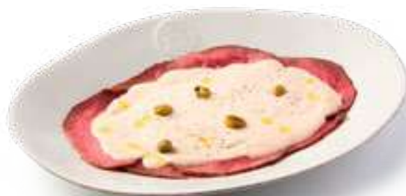
Вителло Тонато Vitello Tonato