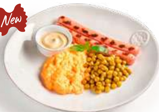
Зеленый горошек с сосисками Green peas with sausages

со скремблом и сметанно-горчичным соусом