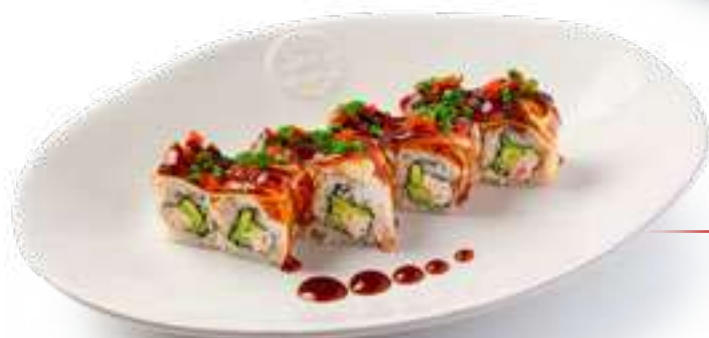
С угрем и снежным крабом With eel and snow crab

Снежный краб, угорь, авокадо, огурец, унаги соус