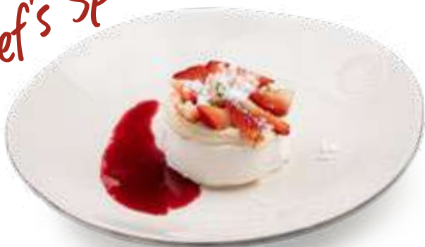
Анна Павлова Pavlova

Торт-бэзе со свежей клубникой и пюре малины