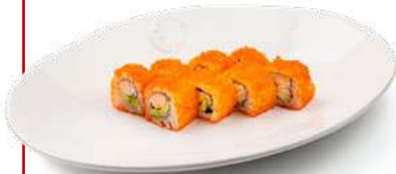
Калифорния с угрем California with eel