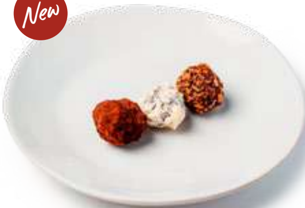
Ассорти конфет Assorted sweets

шоколадный трюфель в какао, шоколадный трюфель в фаутине и конфета с черной смородиной в белом шоколаде