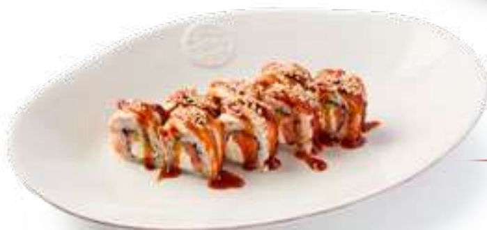
Сливочный угорь Канадиан Creamy Eel Canadian

Угорь, сливочный сыр, лосось, огурец, соус унаги, кунжут