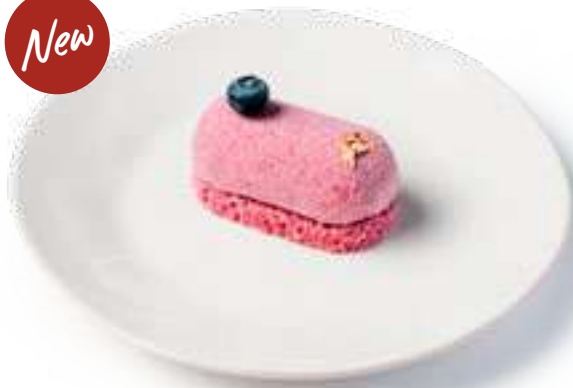
Мусс черная смородина Blackcurrant Mousse

С жидким компоте из малины на бисквите из лаванды, покрыт шоколадным велюром