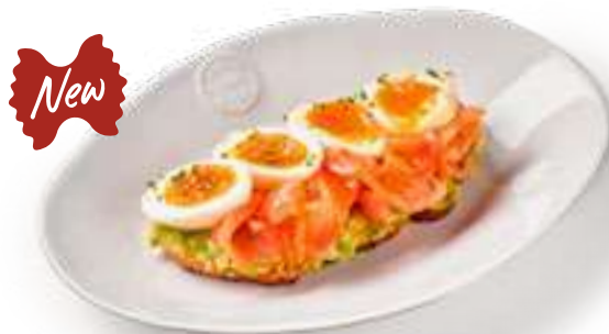
Тост авокадо с лососем Avocado toast with salmon На сером хлебе с отварным куриным яйцом