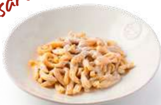
Казаречче 4 сыра с трюфельным кремом Casarecce 4 cheeses with truffle cream