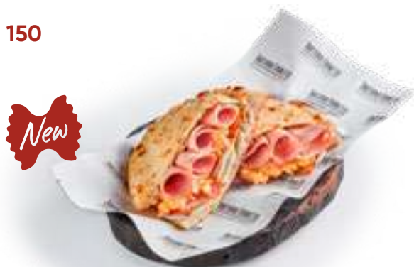
Пучча с мортаделлой и беконом Puccia with mortadella and bacon трюфельный соус, домашний сыр, скрембл