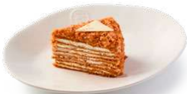
Медовик Honey Cake