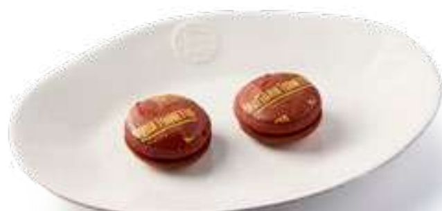
Печенье брауни 2 шт Brownie cookies 2 pcs