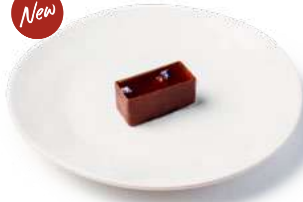
Конфета с мармеладом Candy with marmalade

С апельсиновый мармеладом, горьким шоколадом и васильком