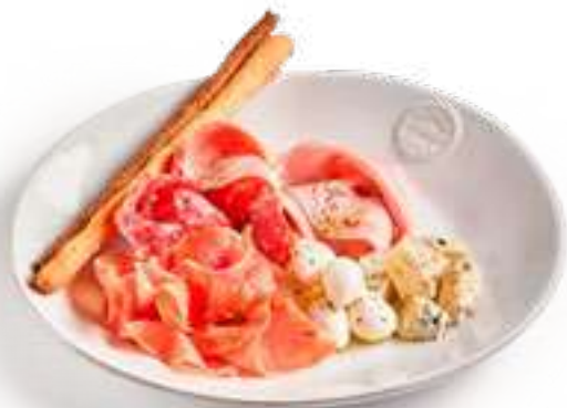
Антипаста Итальяно Antipasti Italiano

мортаделла, пармская ветчина, салями милано, моцарелла, горгонзола, гриссини