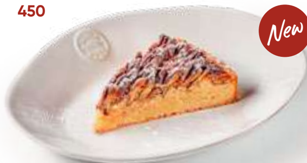
Тарт с пеканом Pecan tart

Из песочного теста сабле с миндальным франжипаном