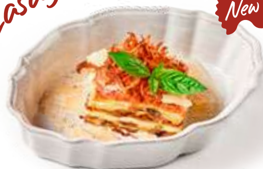
Лазанья с домашней сальсиччей Lasagna with homemade salsiccia