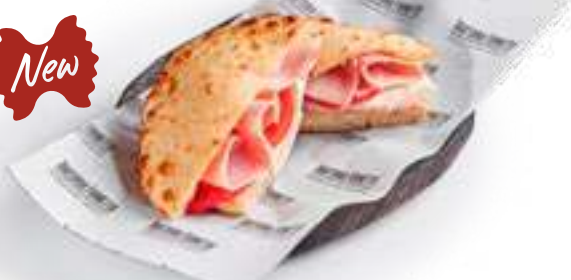
Пучча с ветчиной и сыром Puccia with ham and cheese майонез, ветчина, сыр домашний, томаты