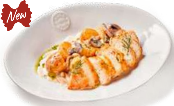
Куриная грудка с грибами и картофелем Chicken breast with mushrooms and potatoes