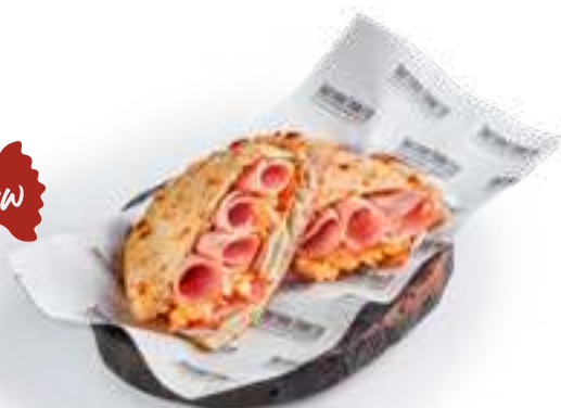
Пучча с мортаделлой и беконом Puccia with mortadella and bacon трюфельный соус, домашний сыр, скрембл