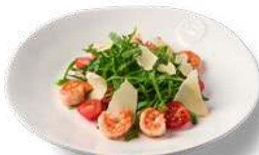
Креветки с руколой и томатами черри Arugula with shrimps