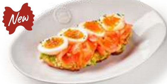
Тост авокадо с лососем Avocado toast with salmon На сером хлебе с отварным куриным яйцом