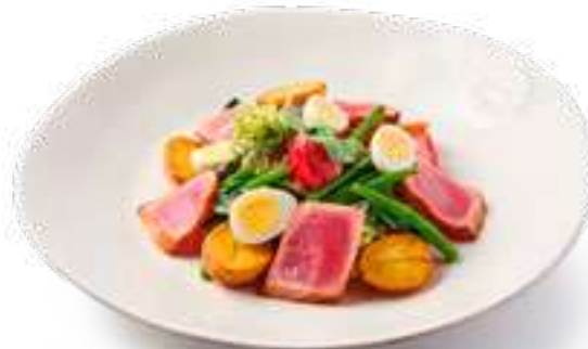
Нисуаз Niçoise Salad

Микс салатов, филе тунца, томаты, оливки, кенийская фасоль, картофель, медово-горчичный соус