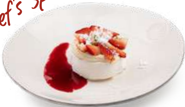
Анна Павлова Pavlova

Торт-бэзе со свежей клубникой и пюре малины