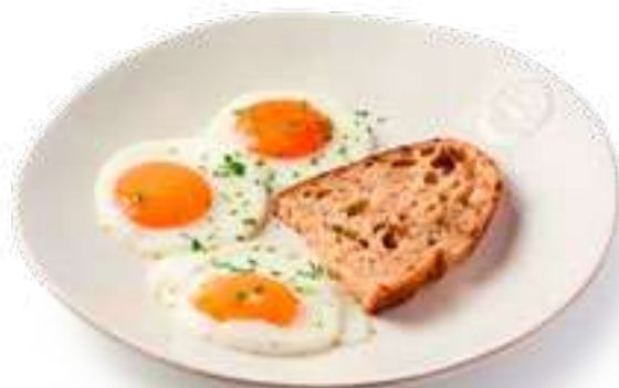
Яичница из 3-х яиц с пармезаном 3 fried eggs with parmesan