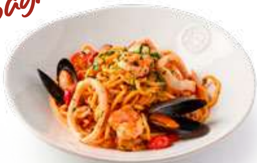
Спагетти Фрутти ди Маре Spaghetti Frutti di Mare

Мидии, кальмары, креветки, томатный соус