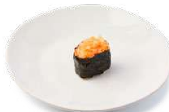
Спайси креветка Spicy shrimp