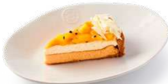
Чизкейк манго-маракуйя Mango Passion Fruit Cheesecake