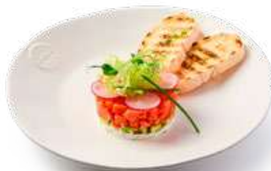
Тартар из лосося Salmon tartare