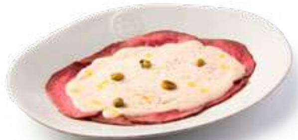
Вителло Тонато Vitello Tonato