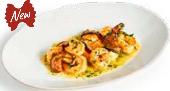
Креветки в соусе Аль Бурро с цукини Shrimp in Al Burro sauce with zucchini