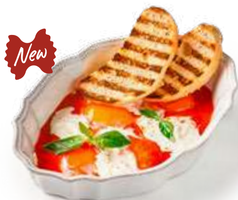
Яичница по-неаполитански Scrambled eggs Neapolitan style