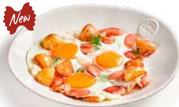
Яичница с сосисками и картофелем Scrambled eggs with sausages and potatoes