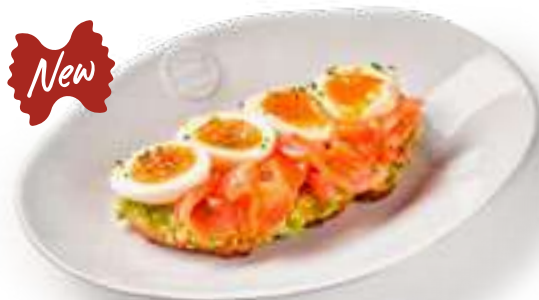
Тост авокадо с лососем Avocado toast with salmon На сером хлебе с отварным куриным яйцом