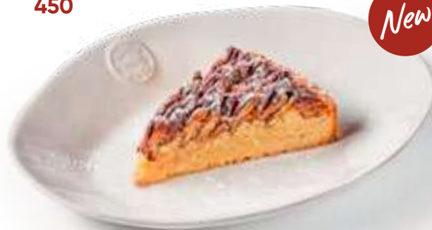
Тарт с пеканом Pecan tart

Из песочного теста сабле с миндальным франжипаном