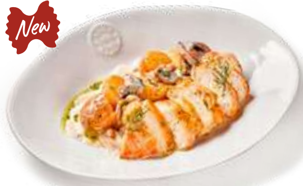
Куриная грудка с грибами и картофелем Chicken breast with mushrooms and potatoes