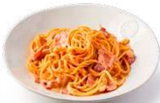
Спагетти Карбонара Spaghetti Carbonara