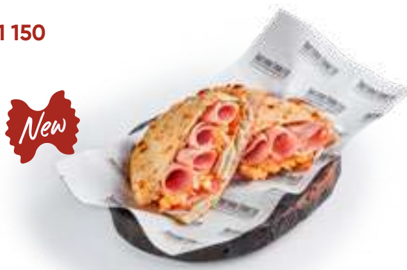
Пучча с мортаделлой и беконом Puccia with mortadella and bacon трюфельный соус, домашний сыр, скрембл