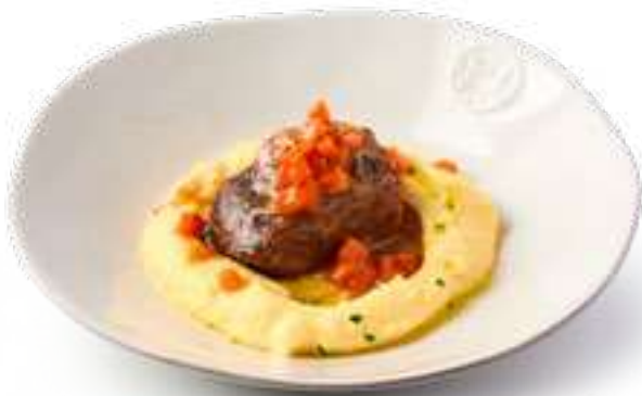
Говяжьи щечки с картофельным пюре Beef cheeks with mashed potatoes