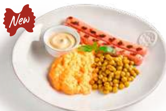
Зеленый горошек с сосисками Green peas with sausages

со скремблом и сметанно-горчичным соусом