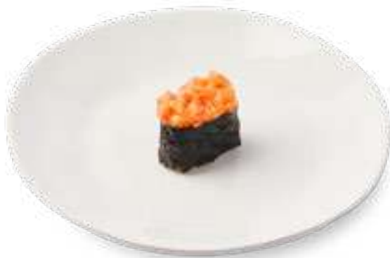
Спайси лосось Spicy Salmon