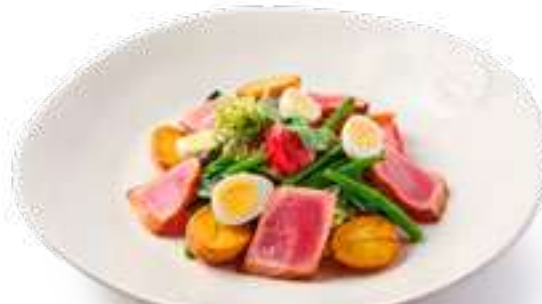
Нисуаз Niçoise Salad

Микс салатов, филе тунца, томаты, оливки, кенийская фасоль, картофель, медово-горчичный соус