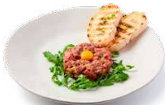
Тартар из мраморной говядины Marbled beef tartare