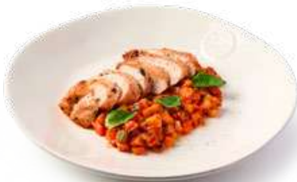
Куриное бедро с овощным рагу Chicken thigh with vegetable stew

из баклажана, цукини и болгарского перца с томатным соусом