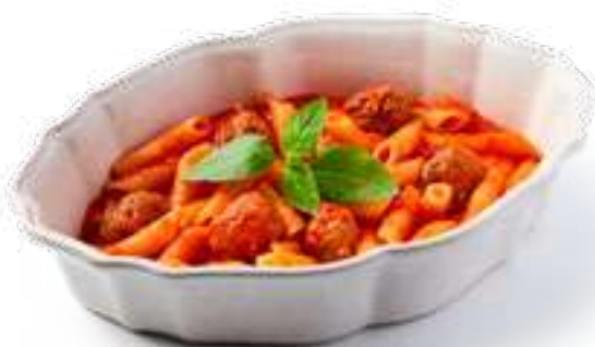
Пенне с польпетте Maccheroni with poppers

Тефтели из говядины, томатный соус, базилик