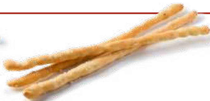
Гриссини пшеничные Wheat grissini