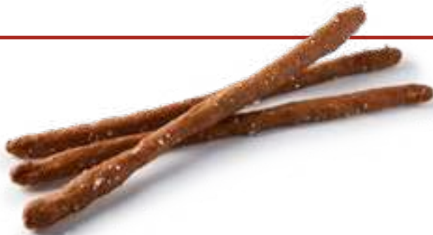
Гриссини ржаные Rye Grissini