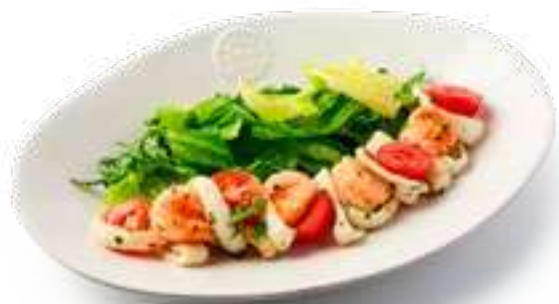
Теплый салат с морепродуктами Warm salad with seafood

Креветки, кальмары, микс салатов, томаты черри и соус цитронет