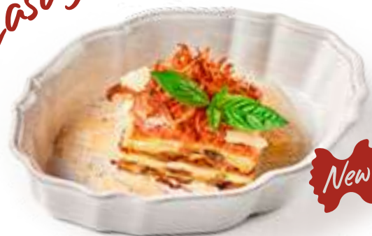
Лазанья с домашней сальсиччей Lasagna with homemade salsiccia