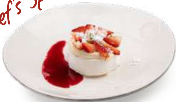
Анна Павлова Pavlova

Торт-бэзе со свежей клубникой и пюре малины