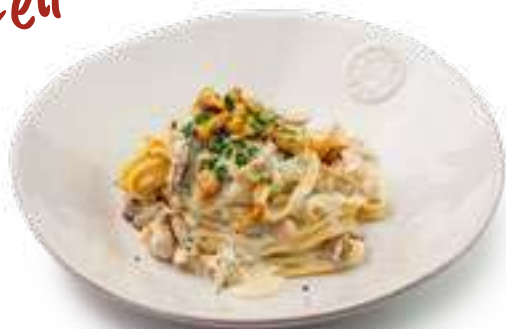
Фетучини с грибами Fettuccine with mushrooms

Шампиньоны, вешенки, сливки, пармезан, петрушка