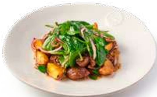
Салат с куриной печенью Salad with chicken liver

с картофелем беби, мини-шпинатом и бальзамическим кремом