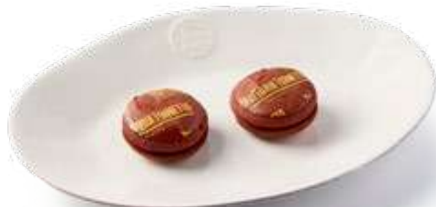
Печенье брауни 2 шт Brownie cookies 2 pcs