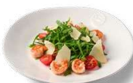
Креветки с руколой и томатами черри Arugula with shrimps