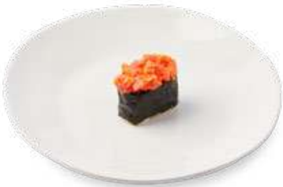
Спайси тунец Spicy tuna