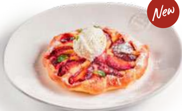
Галета со сливой Pavlova

Из творожного теста с миндальным кремом, запеченной сливой и ванильным мороженым