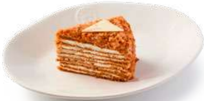
Медовик Honey Cake