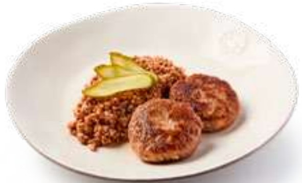
Котлеты из телятины с гречневым ризотто и пармезаном Veal cutlets with buckwheat risotto and parmesan