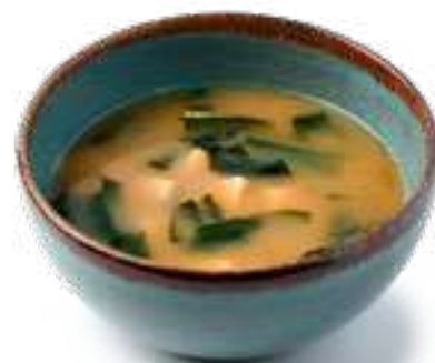
Мисо суп с сыром тофу Miso soup with tofu