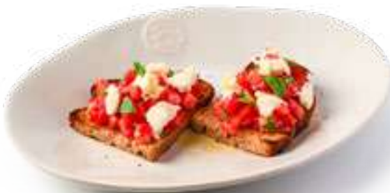
Брускетта с томатами и моцареллой Bruschetta with tomatoes and mozzarella

Серый хлеб, розовые томаты, моцарелла, чеснок, базилик