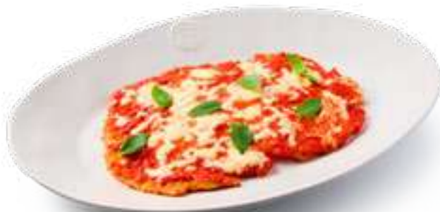
Куриный шницель с моцареллой и соусом Наполи Chicken schnitzel with mozzarella and Napoli sauce