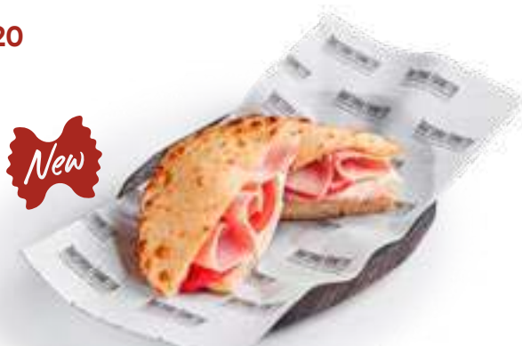
Пучча с ветчиной и сыром Puccia with ham and cheese майонез, ветчина, сыр домашний, томаты