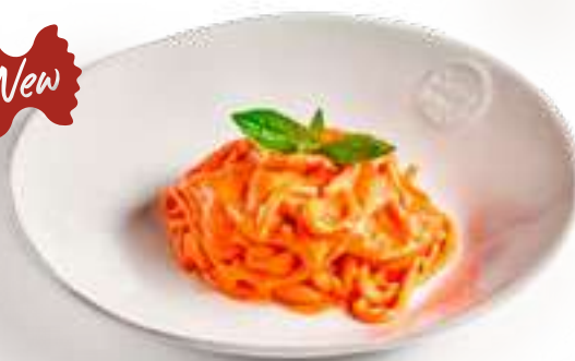
Спагетти Арабьятта Карбонара Spaghetti Carbonara

Томатный соус, перец чили, яичный желток, пармезан