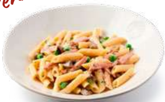
Пенне Боскайоло Penne Boscaiolo