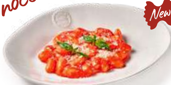
Ньокки Алла-Соррентино Gnocchi Alla-Sorrentino

Томатный соус, моцарелла, пармезан, базилик