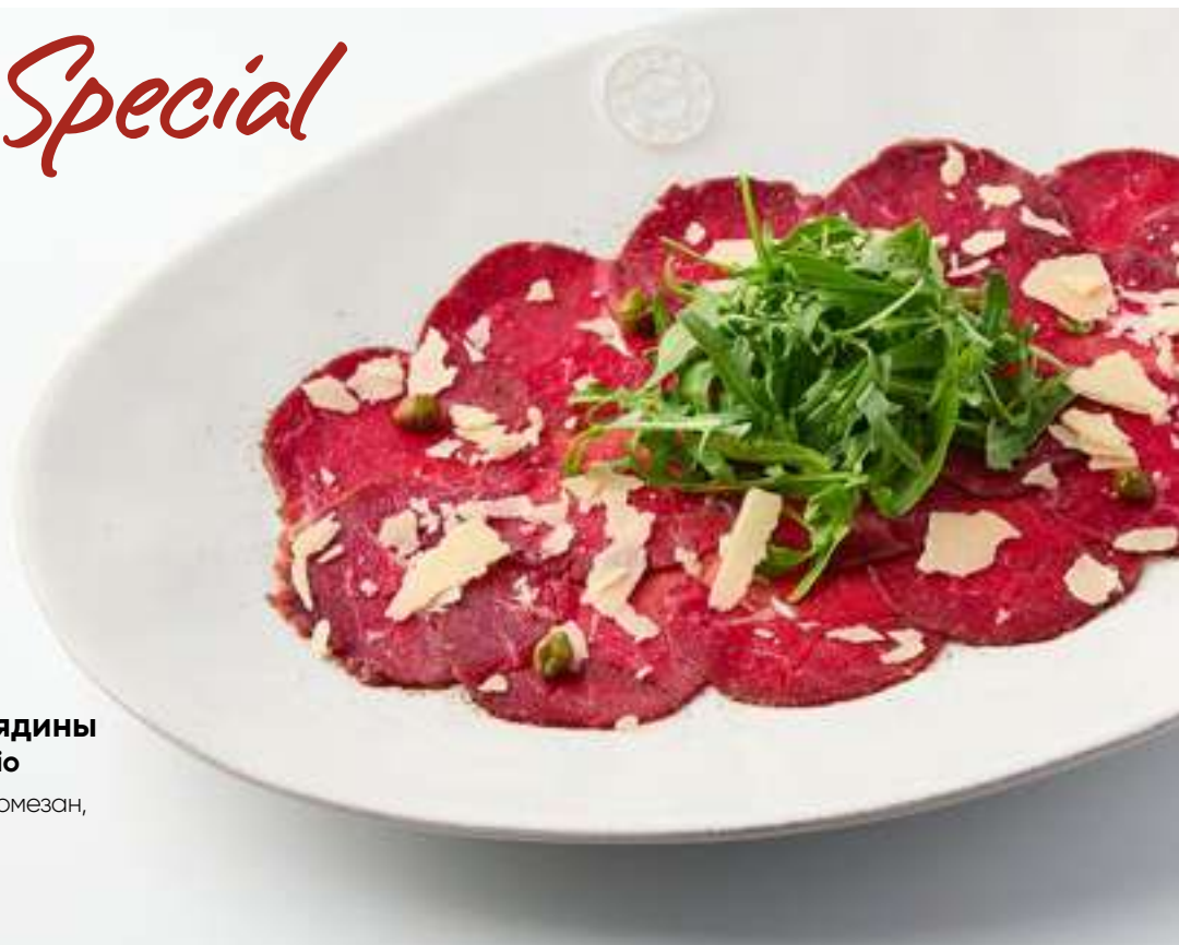
Карпаччо из мраморной говядины Marbled beef carpaccio

Мраморная говядина, пармезан, каперсы, рукола