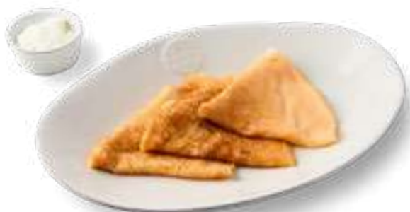
Блинчики со сметаной / медом / ягодным джемом Pancakes with sour cream / honey / berry jam