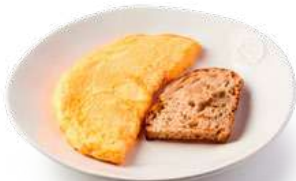
Омлет классический с пармезаном Classic omelette with parmesan