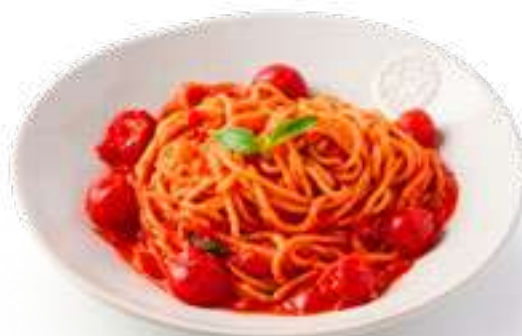
Спагетти Аль Помодоро Spaghetti Al Pomodoro