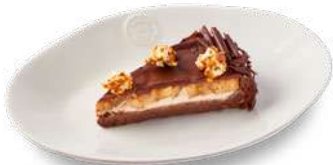
Банановый брауни Banana brownie