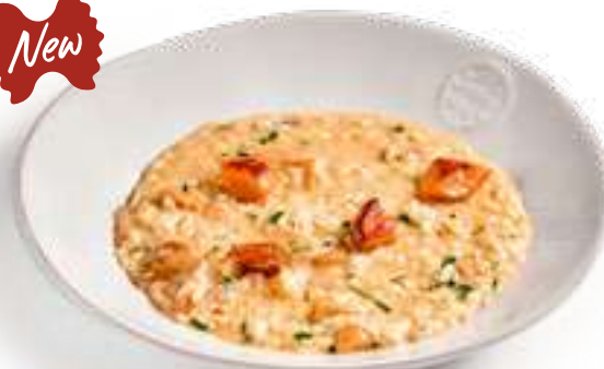
Ризотто с белыми грибами Risotto with porcini mushrooms