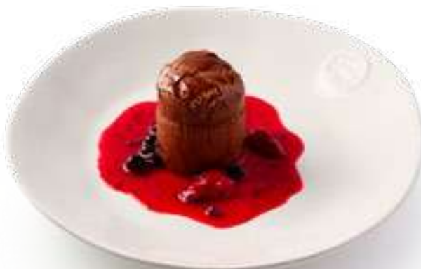
Шоколадный фондан с фисташковой начинкой Chocolate fondant with pistachio filling