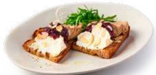
Брускетта с куриным паштетом и луковым джемом Bruschetta with chicken pate and onion jam

На сером хлебе с творожным сыром, карамелизированным луком с мёдом