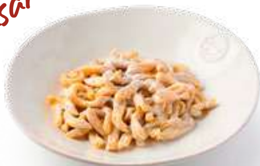
Казаречче 4 сыра с трюфельным кремом Casarecce 4 cheeses with truffle cream