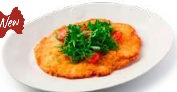
Куриный шницель Алла Миланезе Chicken schnitzel Alla Milanese