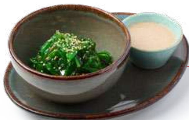
Салат Чука с ореховым соусом Chuka salad with walnut sauce