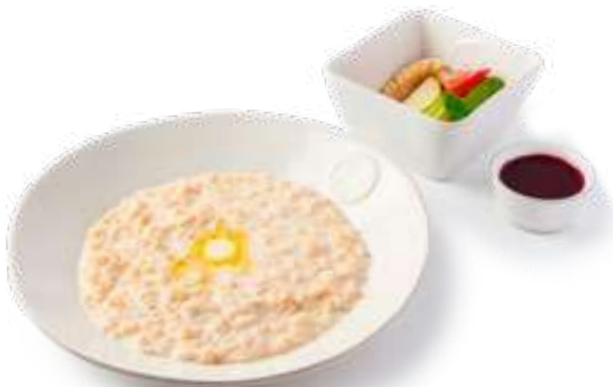
Овсяная каша с фруктами на воде / молоке / миндальном молоке Oatmeal with fruit on the water / milk / almond milk