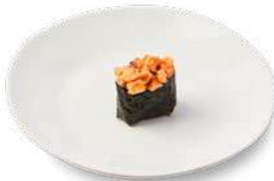
Спайси угорь Spicy eel