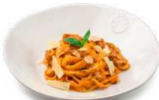
Фетучини с курицей и грибами Fettuccine with chicken and mushrooms

Шампиньоны, вешенки, сливки, пармезан, петрушка