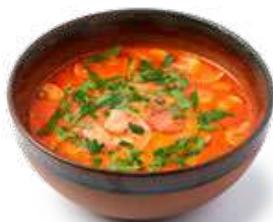
Суп Том Ям с морепродуктами Soup Tom Yum with seafood