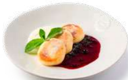
Сырники со сметаной и черничным вареньем Cheese pancakes with sour cream and blueberry jam