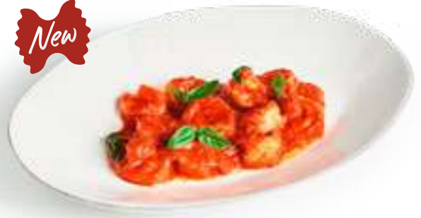
Креветки в соусе Аль Помодоро Shrimp in Al Pomodoro sauce