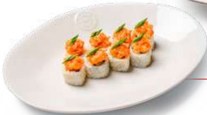
Темпура ролл с чукой и угрем Tempura roll with chuka and eel