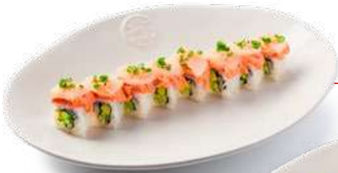
С лососем и гребешком With salmon and scallop