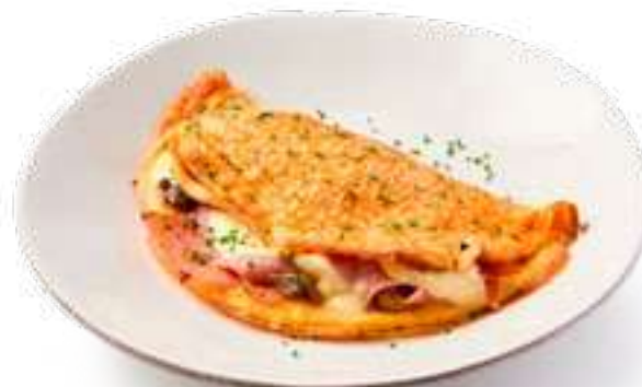
Омлет с ветчиной, грибами и моцареллой Omelette with ham, mushrooms and mozzarella