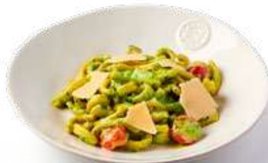
Казаречче с курицей и песто Casarecce with chicken and pesto