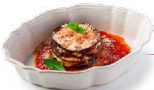
Запеченные баклажаны Пармиджано ди меланзане Baked eggplant Parmigiano di melanzane

Баклажаны, томатный соус, моцарелла, пармезан