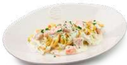
Фетучини с лососем Fettuccine with salmon