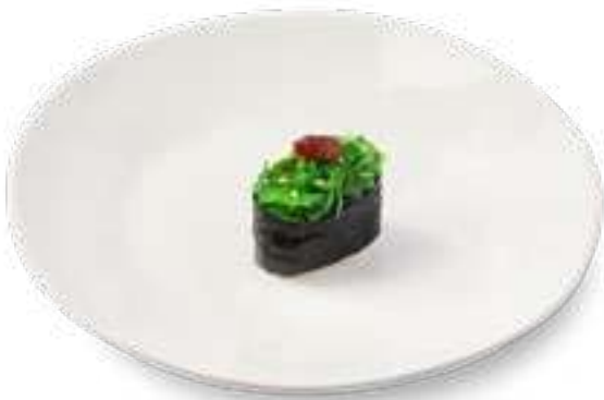
Спайси Чука Spicy Chuka