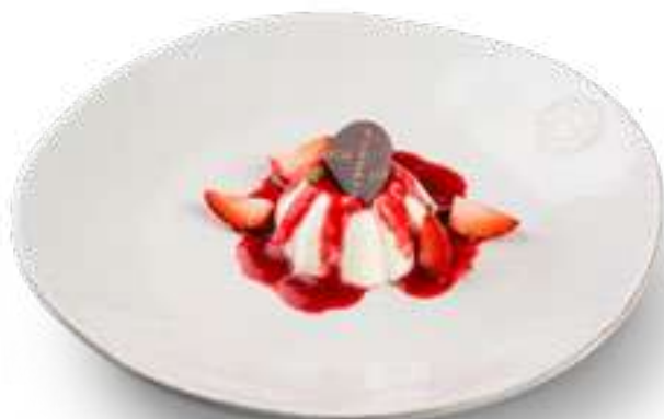
Панна-котта Panna cotta