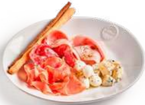
Антипаста Итальяно Antipasti Italiano

мортаделла, пармская ветчина, салями милано, моцарелла, горгонзола, гриссини