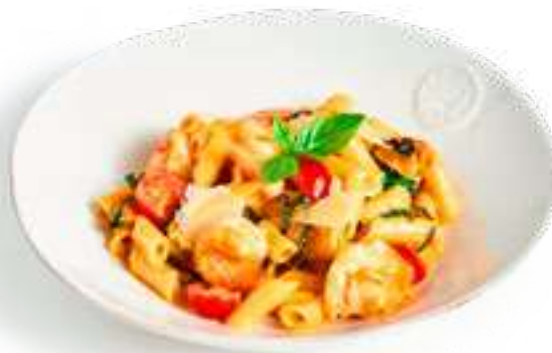
Пенне с креветками и цукини Penne with shrimp and zucchini

Белое вино, томаты черри, базилик, пармезан