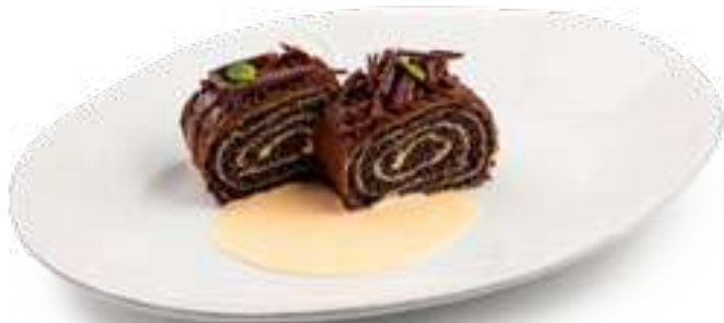
Маковый рулет Poppy roll

Рулет из дрожжевого теста с маком и шоколадом