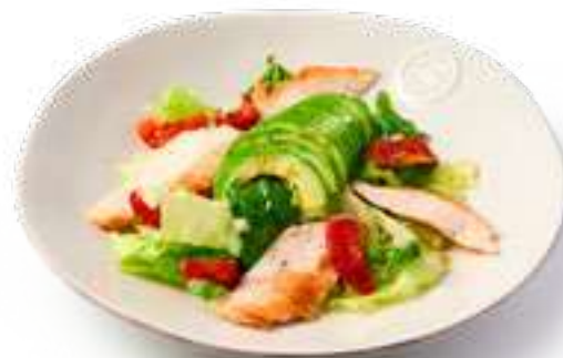
Салат с курицей Salad with chicken

Микс салатов, авокадо, вяленые томаты и медово-горчичная заправка