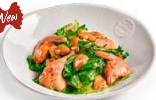
Салат с перепелкой и белыми грибами Salad with quail and porcini mushrooms

Микс салатов, обжаренная перепелка, белые грибы, медово-горчичная заправка