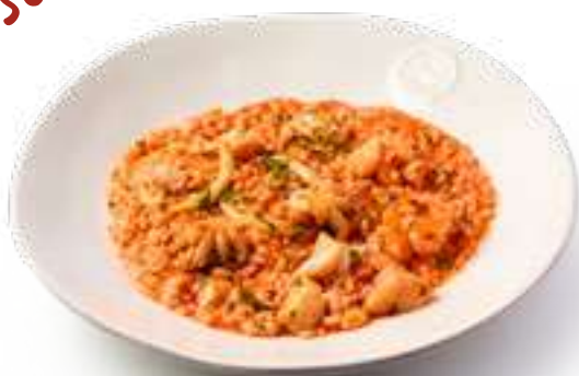
Ризотто с морепродуктами Risotto with seafood

Кальмар, креветки, осьминог, соус томатный, пармезан