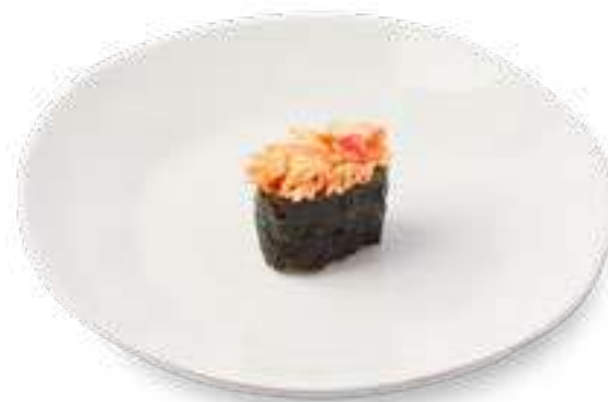
Спайси краб Spicy crab